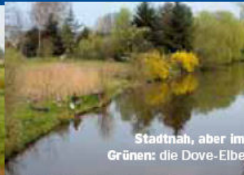
Stadtnah, aber im Grünen: die Dove-Elbe