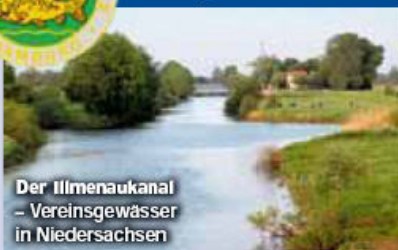
Der Illmenaukanal - Vereinsgewässer in Niedersachsen