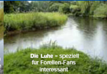
Die Luhe - speziell für Forellen-Fans interessant