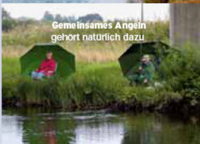
Gemeinsames Angeln gehört natürlich dazu